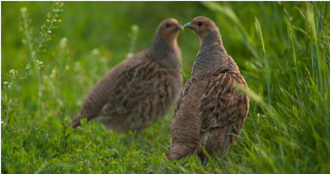
Das Rebhuhn ist der Vogel des Jahres 2026, Fotografie: Dietmar Nill.

Unabhängig von den angebotenen Touren kann auch jeder selbst ein eigenes Monitoring durchführen. Dafür sind kaum Vorkenntnisse erforderlich und die investierte Zeit ist überschaubar. Die Teilnehmenden benötigen lediglich ein Mobilfunkgerät, einen kleinen Lautsprecher und ein Fernglas. Eine Anleitung für die Durchführung des Monitorings und der dabei einzuhaltenden Verhaltensregeln in der Natur sind unter www.biosphaerengebiet-alb.de/veranstaltungen einzusehen. Hinweise, Fragen oder mögliche Sichtungungen können den Rangerinnen und Rangern per E-Mail über Ranger-Team@rpt.bwl.de mitgeteilt werden.